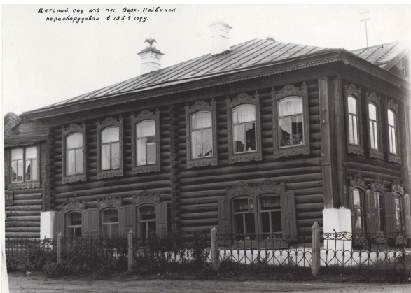
Дом по ул. Ленина, 26. 1960 - е гг.

Первое. Возраст наличника - более ста лет, изготовлен он в период между 1890 и 1910 годами.