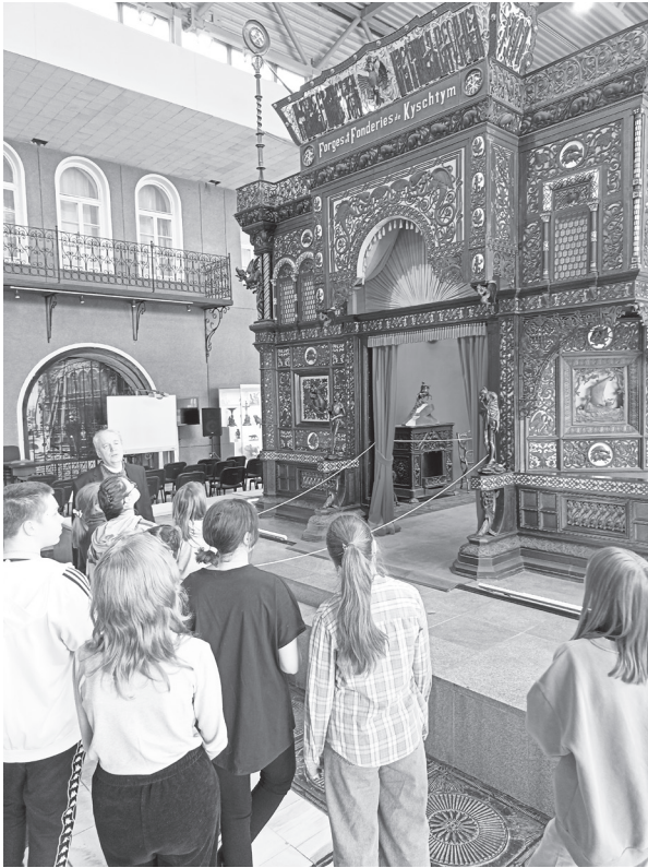
Екатеринбургского музея изобразительных искусств».

В экспозиции камнерезного искусства экскурсанты познакомились с разнообразием и красотой уральских поделочных и драгоценных камней, увидели изделия признанных художников и совсем молодых камнерезов, также посетили залы русской и европейской живописи, экспозицию советского искусства и временную выставку «Запечатленный свет. Русский импрессионизм из коллекций Нижегородского государственного художественного музея и