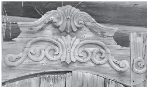
Очелье наличника с дома по ул. Ленина, 26.