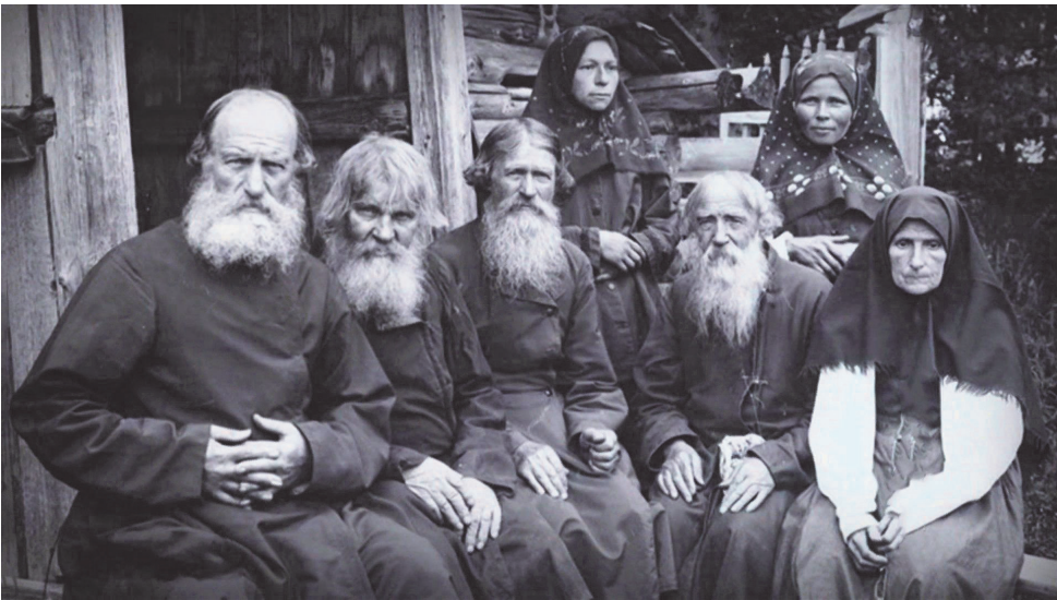
Уральская община старообрядцев. Конец XIX века.