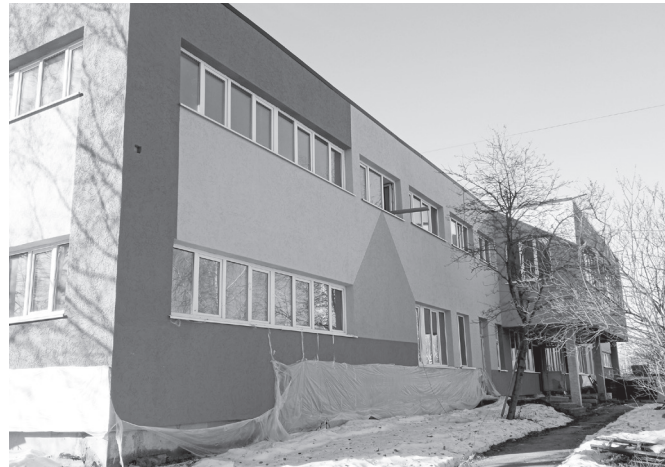
Корпус № 1, вид снаружи.